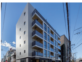
フレンシア青葉台 (2024年1月竣工)