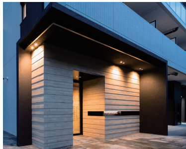
グランエール駒込 (2020年11月竣工)