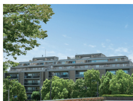
フレンシア外苑西 (2008年2月竣工)

まず上質であること。私たち相互住宅には、1955年の設立以来、いつの時代も変わることのない約束があります。