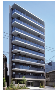
グランエール森下 WEST (2025年5月竣工)