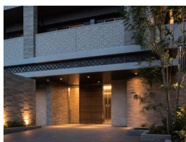
フレンシア高円寺北 (2021年9月竣工)