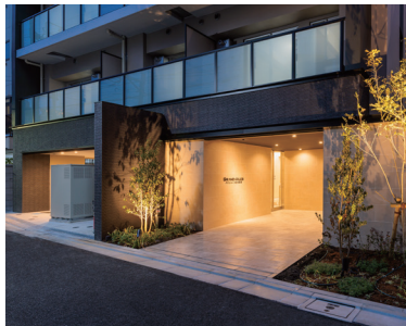
グランエール西日暮里 (2025年3月竣工)